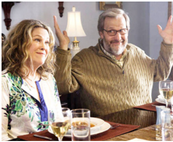
2009 AWAY WE GO (Away we go) de Sam Mendes avec Catherine O'Hara