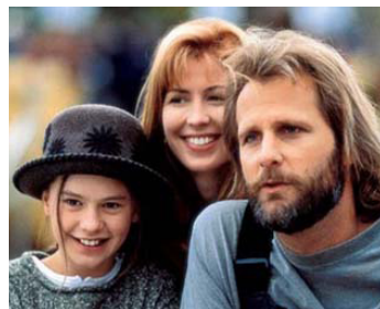
1996 L'ENVOLÉE SAUVAGE (Fly away home) de C. Ballard avec Anna Paquin, Dana Delany