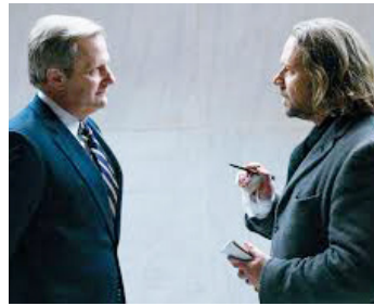
2009 JEUX DE POUVOIR (State of Play) de Kevin MacDonald avec Russell Crowe