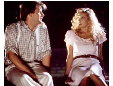
1991 LA FEMME DU BOUCHER (The Butcher's Wife) de Terry Hughes avec Demi Moore