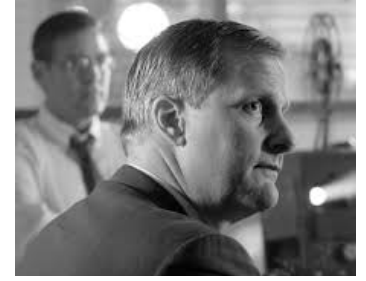
2005 GOOD NIGHT AND GOOD LUCK de et avec George Clooney