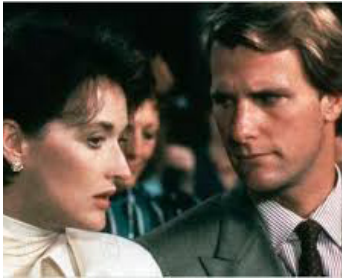
1986 LA BRÛLURE (Heartburn) de Mike Nichols avec Meryl Streep