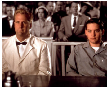
1998 PLEASANTVILLE (Pleasantville) de Gary Ross avec Jake Gyllenhaal