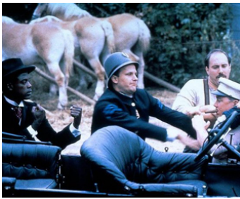
1981 RAGTIME (Ragtime) de Milos Forman avec Moses Gunn