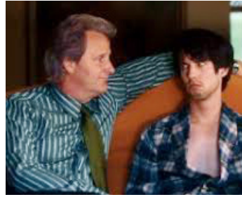
2007 FILS À MAMAN (Mama's Boy) de Tim Hamilton avec Jon Heder