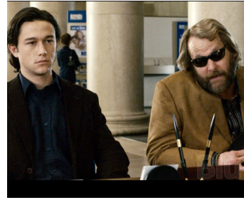
2007 THE LOOKOUT (The Lookout) de Scott Frank avec Joseph Gordon-Hewitt