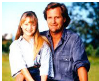
1992 TIMESCAPE, LE PASSAGER DU FUTUR (Timescape) de David Twohy avec Ariana