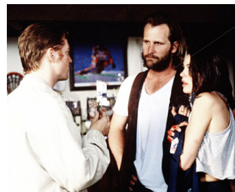
1996 DEUX JOURS À LOS ANGELES (2 Days in the Valley) de JJ. Herzfeld avec E. Stoltz, T. Hatcher