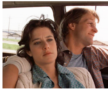
1983 TENDRES PASSIONS (Terms of Endearment) de James L. Brooks avec Debra Winger