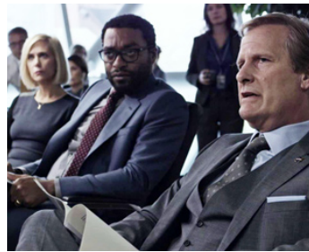
2015 SEUL SUR MARS (The Martian) de Ridley Scott avec Kristin Wiig, Chewitel Ejiofor