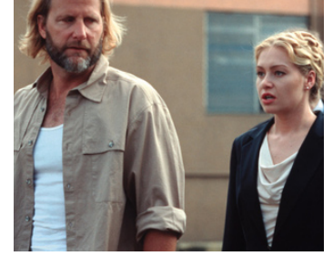
2003 I WITNESS de Rowdy Herrington avec Portia de Rossi