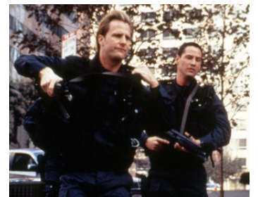
1994 SPEED (Speed) de Jan de Bont avec Keanu Reeves