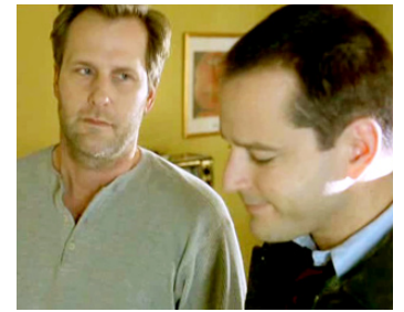
2000 INSOMNIES (Chasing Sleep) de Michael Walker avec Gil Bellows