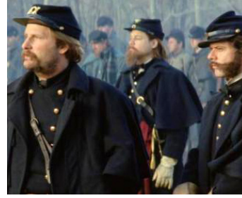
2003 DES DIEUX ET DES GÉNÉRAUX (Gods and Generals) de Ronald F. Maxwell