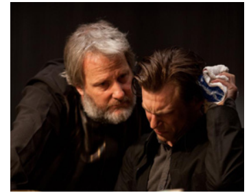
2012 LOOPER (Looper) de Rian Johnson avec Noah Sagan