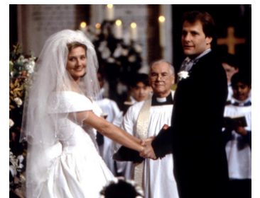
1996 LES 101 DALMATIENS (101 Dalmatians) de Stephen Herek avec Joely Richardson