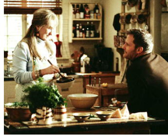
2002 THE HOURS (The Hours) de Stephen Daldry avec Meryl Streep