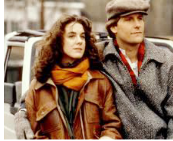
1988 L'AMOUR À 4 TEMPS (Sweet Hearts Dance) de Robert Greenwald avec Elizabeth Perkins