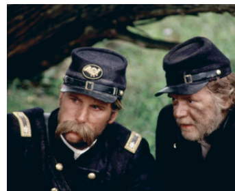
1993 GETTYSBURG (Gettysburg) de Ronald F. Maxwell avec Kevin Conway