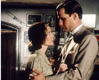
1985 LA ROSE POURPRE DU CAIRE (The Purple Rose of Cairo) de Woody Allen avec Mia Farrow