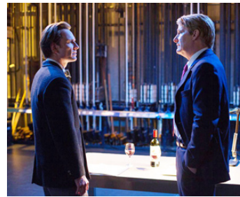
2016 STEVE JOBS (Steve Jobs) de Danny Boyle avec Michael Fassbender