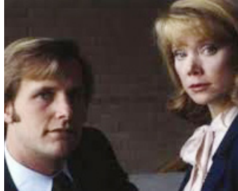
1985 MARIE (Marie, a truth Story) de Roger Donaldson avec Sissy Spacek