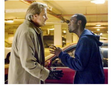
2008 TRAHISON (Traitor) de Jeffrey Nachmanoff avec Don Cheadle