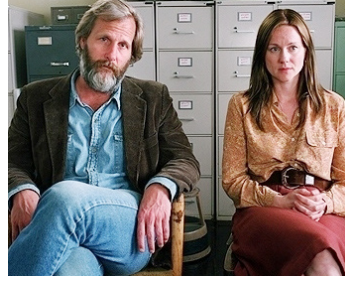
2005 LES BERKMAN SE SÉPARENT (The Squid and the Whale) de N. Baumbach avec Laura Linney