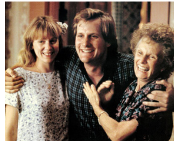
1991 MAUX D'AMOUR (Love Hurts) de Bud Yorkin avec Amy Wright, Cloris Leachman