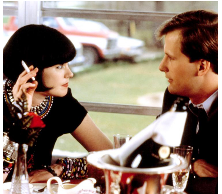
1986 DANGEREUSE SOUS TOUS RAPPORTS (Something Wild) de Jonathan Demme avec Melanie Griffith