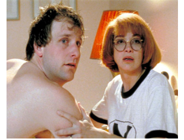
1989 CHECKING OUT (Checking Out) de David Leland avec Melanie Mayron