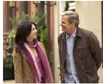
2009 THE ANSWER MAN (The Answer Man) de John Hindman avec Lauren Graham