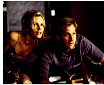
1999 MON MARTIEN BIEN AIMÉ (My Favorite Martian) de Donald Petrie avec Daryl Hannah