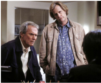
2002 CRÉANCE DE SANG (Blood Work) de et avec Clint Eastwood