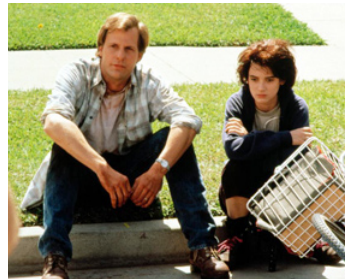
1990 WELCOME HOME, ROXY CARMICHAEL de Jim Abrahams avec Winona Ryder